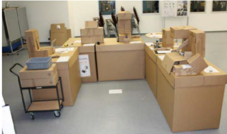
Abb. 1: Beispiel für Card-Board-Engineering in einer U-Shape Zelle

geplant funktionieren können. Bei der Einbeziehung von Links- und Rechtshändern bereits in dieser Phase lassen sich spätere Schwachstellen frühzeitig erkennen und vermeiden.