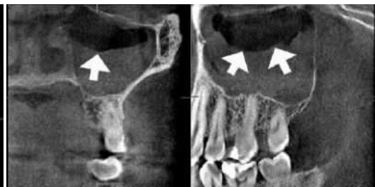
Abb. 4: Spiegelbildung (Pfeile) bei akutem Kieferhöhlenemypem in coronarer (links) sowie sagittaler Schnittebene (rechts)