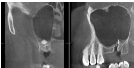
Abb. 3: Fremdkörpersuche: Eine Wurzelspitze wurde bei einer operativen Zahntfernung versehentlich iatrogen in die Kieferhöhle verlagert.