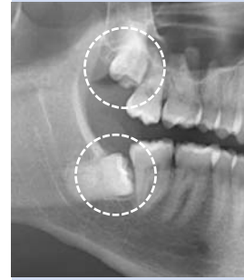
Abb. 1: Im Knochen retinierte Weisheitszähne im Ober- und Unterkiefer. Die Krone des Weisheitszahnes liegt hier unmittelbar am zweiten Backenzahn. Der Zahnhalteapparat des benachbarten Zahnes wird so auf Dauer erheblich geschädigt.

Da dieses Problem bis zu 80 % der jungen Erwachsenen in der europäischen Bevölkerung betrifft, müssen sich die meisten Menschen früher oder später mit der Frage der Zahnentfernung auseinandersetzen. Aus diesem Grunde haben wir diese Informationen für Sie zusammengestellt.