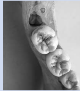
Abb. 3: Weisheitszahn des Unterkiefers im Zahnfach hinter dem zweiten Backenzahn.

Die Empfehlung zu einer Weisheitszahnentfernung ist immer eine individuelle Entscheidung, die Ihr(e)